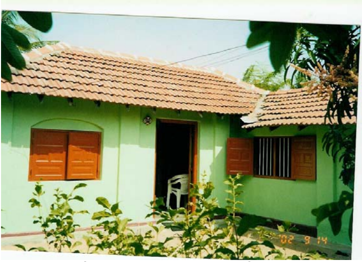
துலைவர் பிரபாகரன் மட்டக்களப்பில் வாழ்ந்த தாமரைக்கேணி வீதியின் 7ம் இலக்க வீடு.