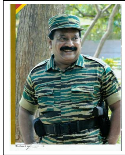
Tamil National Leader V Pirabhakaran

“இயற்கை எனது நண்பன்” “வாழ்க்கை எனது தத்துவாசிரியன்” “வரலாறு எனது வழிகாட்டி”