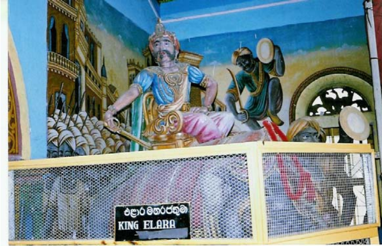
Statue of King ELARA

இன்றைய உலகின் மெக்ஸிக்கோ நாட்டின் தலைநகராக மெக்ஸிக்கோ சிறி குறிக்கப்படுவதுபோல அன்றும் ஈழத்தில் “ஈழஊர்” என்னும் ஓரிடத்தை வரலாற்றில் நாம் காணமுடியும். இது இன்றைய பூநகரிப் பகுதியின் “வேரவில்” எனப்படும் பகுதியாகும். அதன் அருகில் இருக்கும் குடா “ஈழவன் குடா” என அழைக்கப்பட்டது. இவ்வாறு போர்த்துகேயர் காலம்வரை குறிப்பாக 1621ம் ஆண்டு இப்பகுதி ஈழ ஊர் என அழைக்கப்பட்ட வரலாற்றுக் குறிப்புகள் எம்மிடம் உண்டு. (THE TEMPRAL AND SPIRITUL CONQUEST OF CEYLON, FERNAO DE QUEYROZ) அநுராதபுரத்திற்கு வடக்கே இருந்து வருபவர்களை குறிக்கும் சொற்களாக சோழ, ஈழ என்பன பௌத்த இதிகாசங்களில் காணப்படுகின்றன. இதுபோலவே பௌத்த மத இலக்கியமான மகாவம்சத் திலும் மேற்கூறிய ஈழாளனை சோழ நாட்டிலிருந்து வந்ததாக குறிக்கப்பட்டுள்ளது. இந்நிலையில் மூலநூலான தீபவம்சத்தில் இவனுடைய பெயர் (ஈ)ஏலார எனக் குறிப்பிடப்பட்டுள்ளதே தவிர சோழநாட்டில் இருந்து வந்தவன் என்ற குறிப்பேது மில்லை.