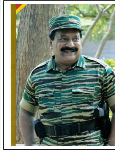
Tamil National Leader V Pirabhakaran

இவ்வாறு ஈழ ஊர்ப்பகுதியிலிருந்து அநுராதபுரத்தை வெற்றி கொண்ட காரணத்தால் இவனுடைய பெயர் ஈழாளன் அல்லது ஈழரா(சா) என அழைக்கப்பட்டுள்ளது. எனினும் மொழிமாற்றத்தில் ஏற்பட்ட தொடரான குளறுபடியால் பின்பு ஈழாளன், ஏலாலன் அல்லது எல்லாளன் என மாற்றமடைந்தது. இவ்வரசன் 44 வருடங்கள் அநுராதபுரத்திலிருந்து நல்லாட்சி செய்தபின் தனது வயோதிப வயதில் துட்டகைமுனு என்னும் இளையனான பௌத்தமத அரசானால் தனிச்சமரில் கொல்லப்பட்டார். இவ்வாறு இவன் வீரமரண மடைந்து அவனது இறுதிக்கிரியை நடைபெற்ற இடத்திலேயே துட்டகைமுனுவால் ஒரு நினைவுத்தூபி அமைக்கப்பட்டு அது ஏழாளன் நினைவுத் தூபி (TOMB) எனவும் அழைக்கப்பட்டு வந்தது. அப்பகுதி ஏழாளனின் நினைவுத் தூபிக்கு அருகா மையில் இருந்ததால் ஏழாளசோண என அன்று முதல் அழைக்கப்பட்டு வருகின்றது. “சோண” என்னும் வடமொழிச் சொல் அருகாமை என்னும் பொருள் கொண்டது.